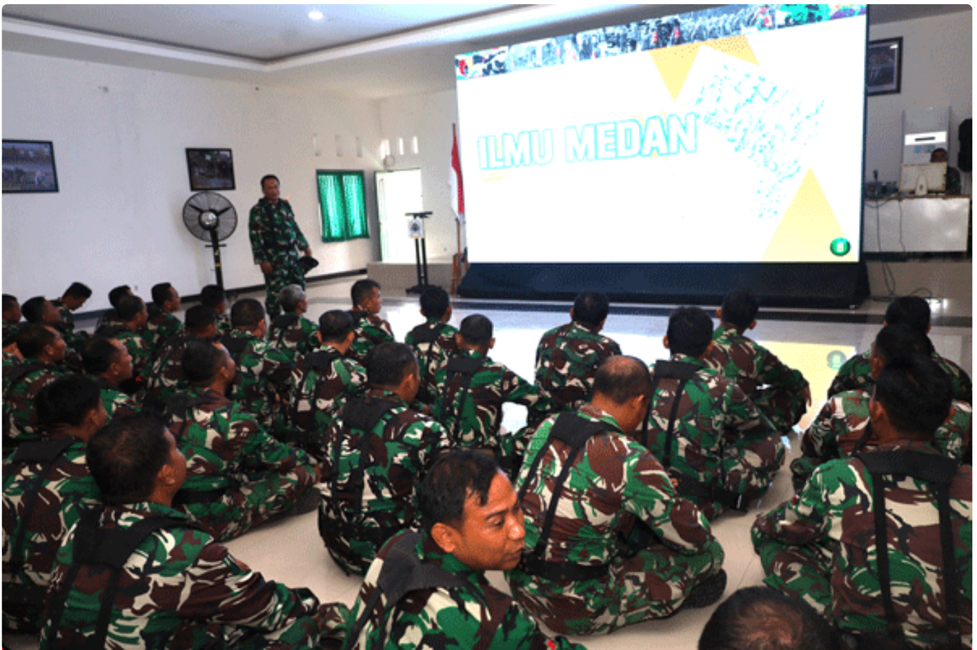
Kodim 0804/Magetan Gelar Latorsar Teritorial dan Latorsar Intel TA 2025

Magetan. - Dalam rangka menunjang dan mengasah kemampuan Prajurit TNI AD, khususnya Personel Kodim 0804/Magetan menggelar Latihan Perorangan Dasar Teritorial dan Intelejen yang dilaksanakan selama 7 Hari dimulai sejak Hari Senin (13/01/2025) s/d Selasa (21/01/2025), yang bertempat di Makodim 0804/Magetan, Jalan Jend. Sudirman No.42, Dusun Kebonagung, Kebonagung, Kec. Magetan, Kabupaten Magetan Jawa Timur, yang diikuti oleh seluruh personel Bintara dan Tamtama Kodim 0804/Magetan serta Anggota Unit Intelijen, Jum'at (17-01-2025).